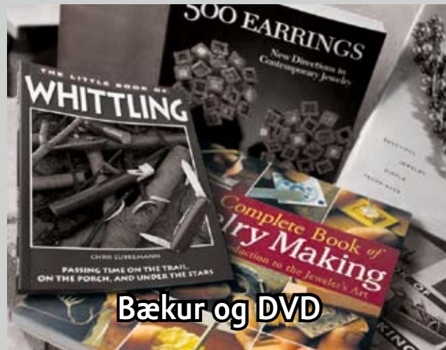
Bækur og DVD