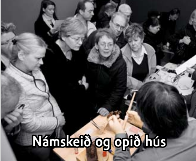
Námskeið og opið hús