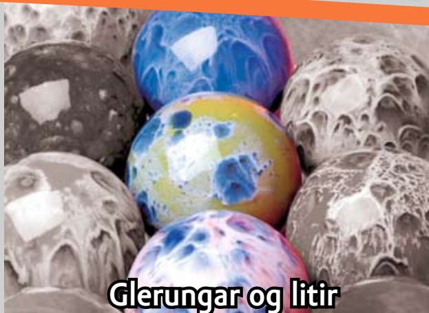
Glerungar og litir

Ný lína af skartgripaleir í mörgum litum sem hertur er í venjulegum eldhúsofni.