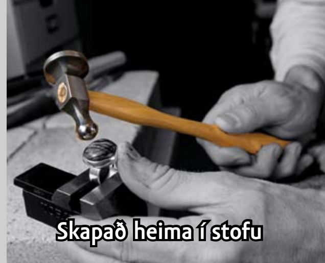
Skapað heima í stofu